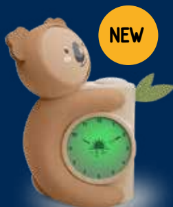
Koala Sleep trainer Coach sommeil Koala KS-KOALA