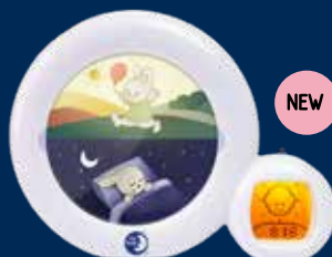
Moon Advanced trainer indicateur avancé CK0014