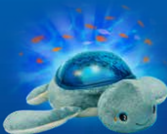
Soft Plush Projector Peluche projecteur AAQ02