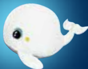
Luminous Plushes Peluches lumineuses SHAKIES