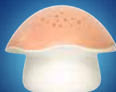
Musical Stars Projector Projecteur d'étoiles musical SP02M-G / SP02M-P