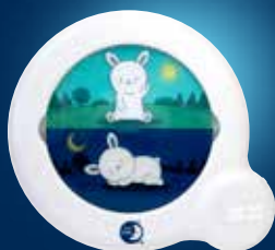
Essential sleeptrainer indicateur Essential CK0042