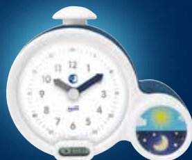
Alarm Clock réveil Clock CK0031 / 10 / 11