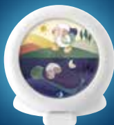
Travel Sleep trainer veilleuse éducative nomade CK0041

Pour aider les enfants à apprendre la notion du temps et dormir plus longtemps, sans savoir lire l'heure, Pabobo invente le premier indicateur de réveil utilisable par les tout-petits dès 2-3 ans.