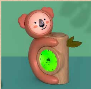
yeux ouverts, lumière verte : on peut se lever !