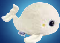
White Noise Plush Night light Peluche veilleuse Bruits Blancs SOLI-Beluga