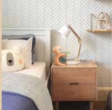
utile et décoratif

éducatif: double affichage de l'heure (numérique / analogique) silencieux (ou alarme sonore) (option indicateur sonore / réveil possible)