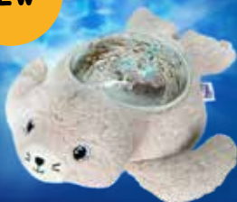
Soft Plush Projector Peluche projecteur AAQ01