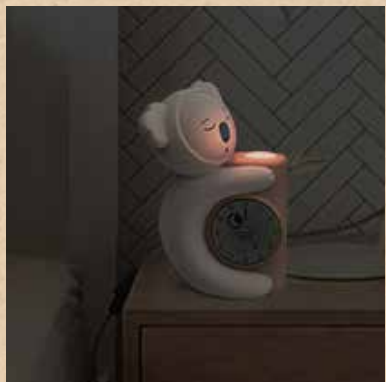
yeux fermés, lumière rouge : on reste au lit